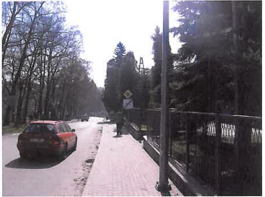
Zdjęcie nr 20