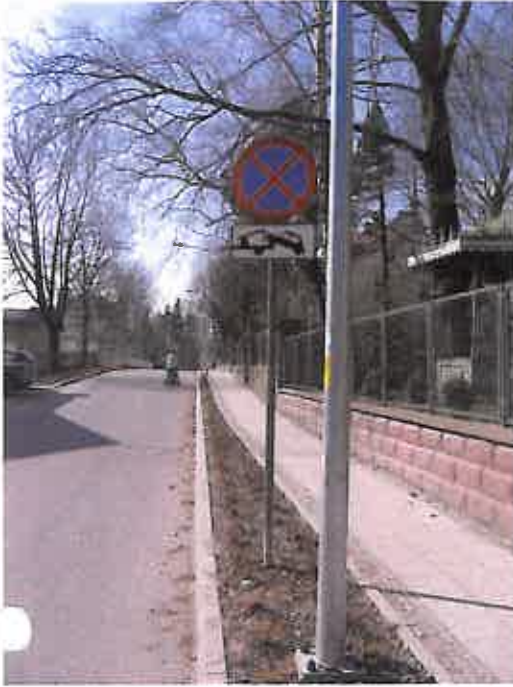
Zdjęcie nr 19