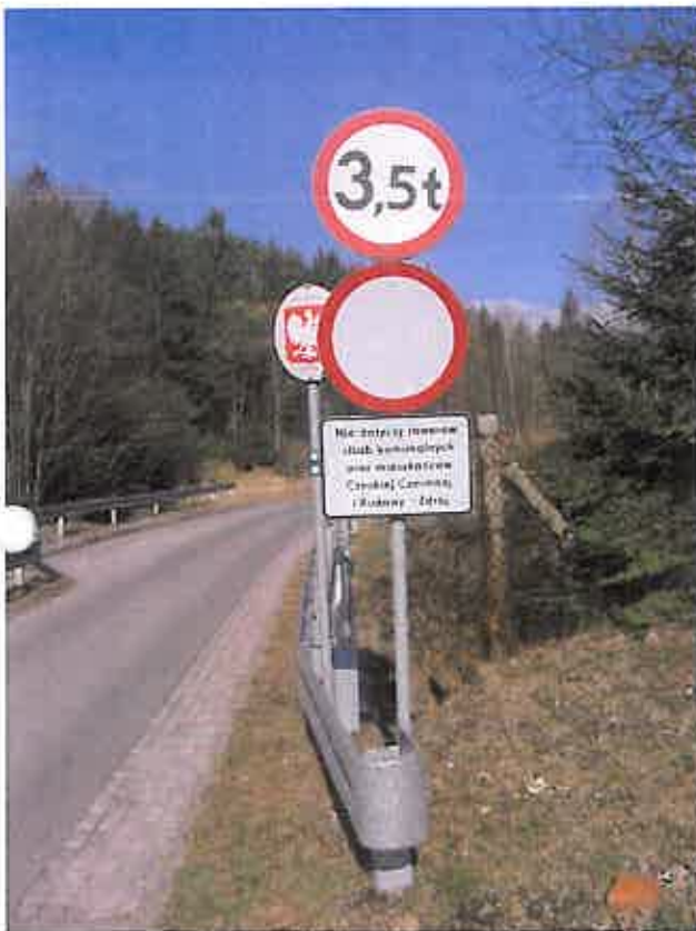
Zdjęcie nr 9