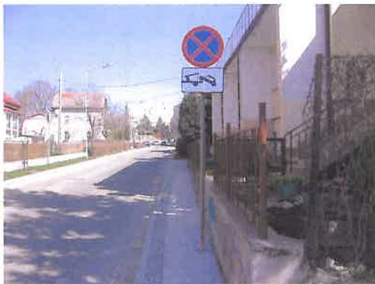
Zdjęcie nr 28