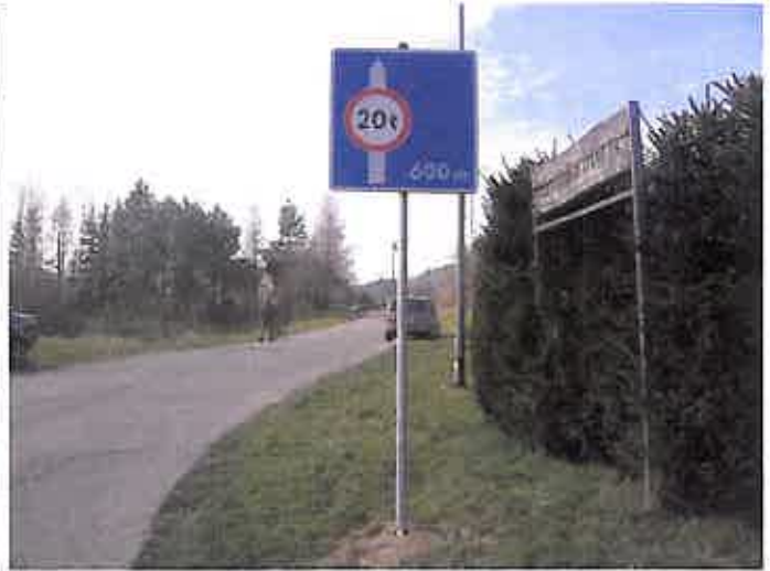
Zdjęcie nr 12