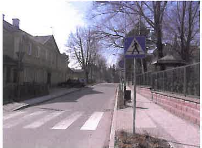
Zdjęcie nr 18