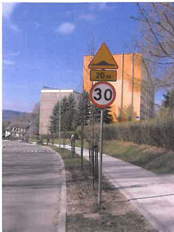
Zdjęcie nr 24