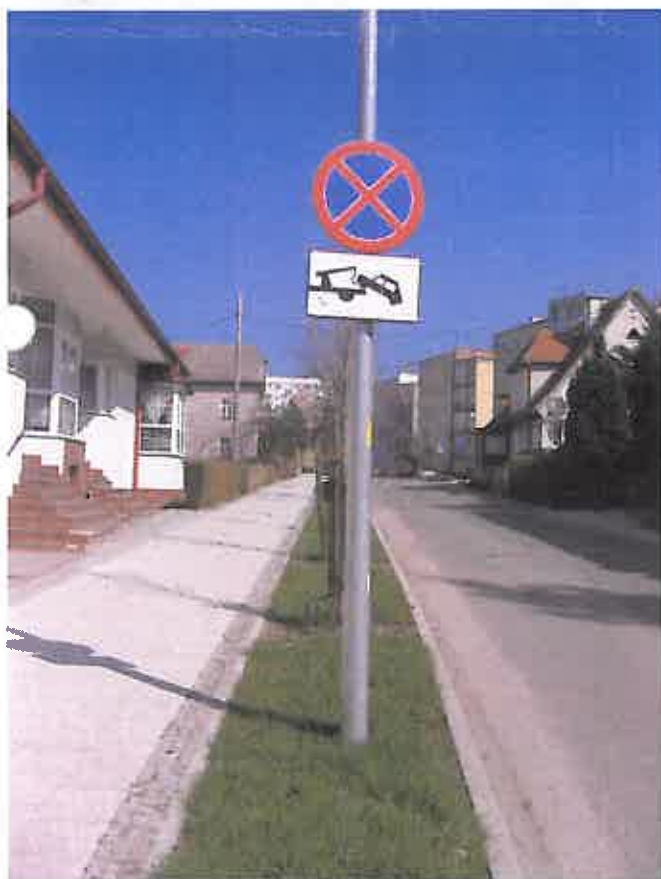
Zdjęcie nr 29