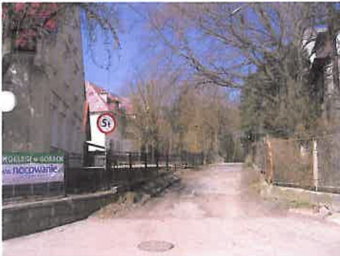
Zdjęcie nr 17