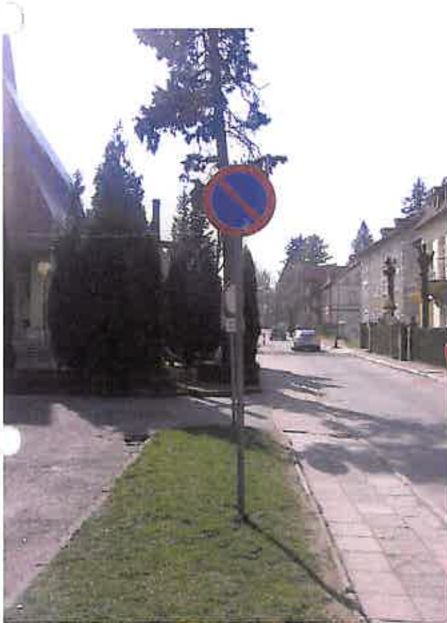
Zdjęcie nr 13