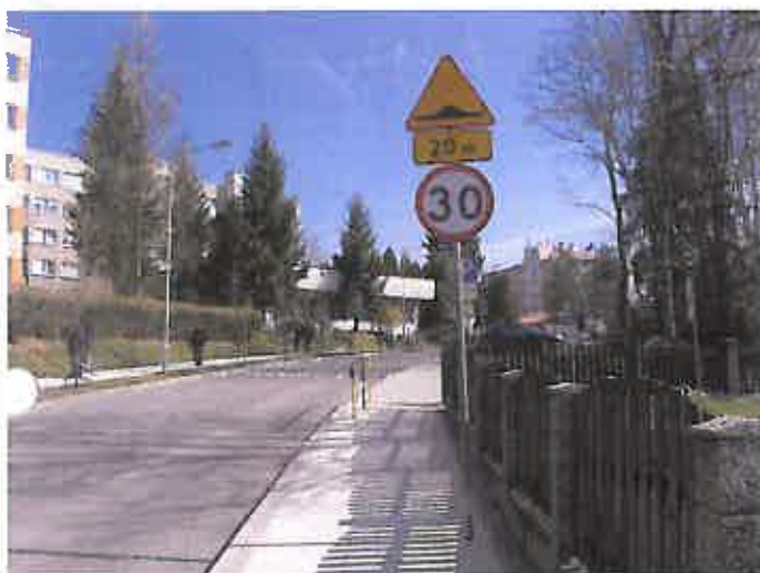
Zdjęcie nr 25