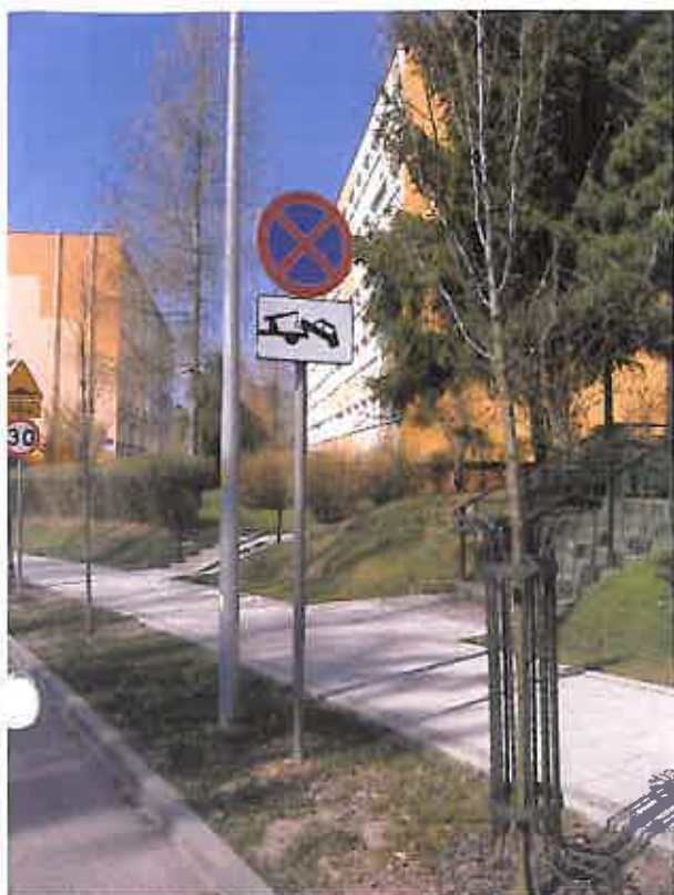
Zdjęcie nr 23