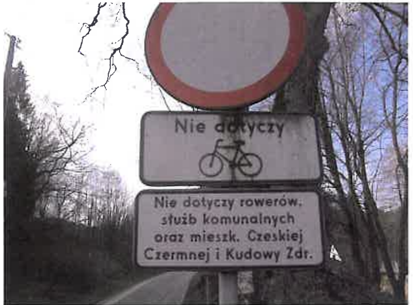
Zdjęcie nr 8