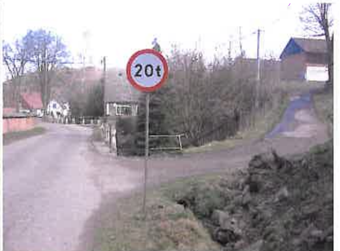
Zdjęcie nr 6