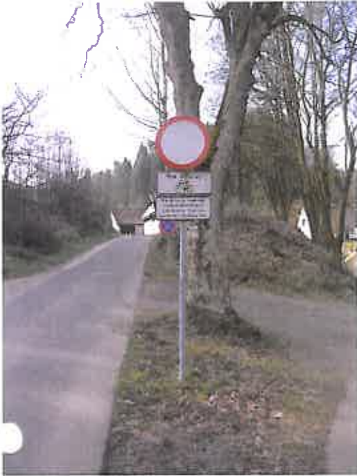
Zdjęcie nr 7