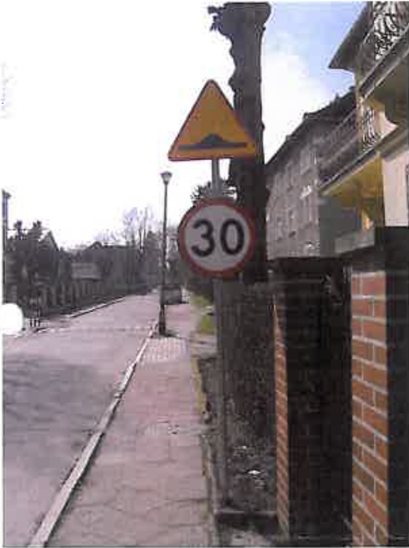
Zdjęcie nr 15