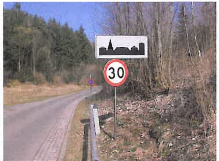
Zdjęcie nr 10