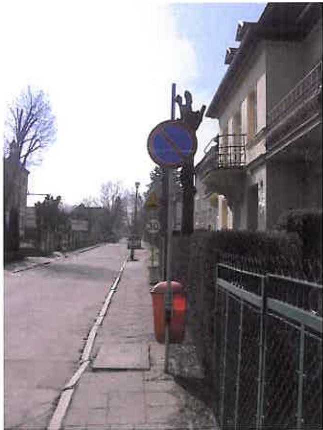
Zdjęcie nr 14