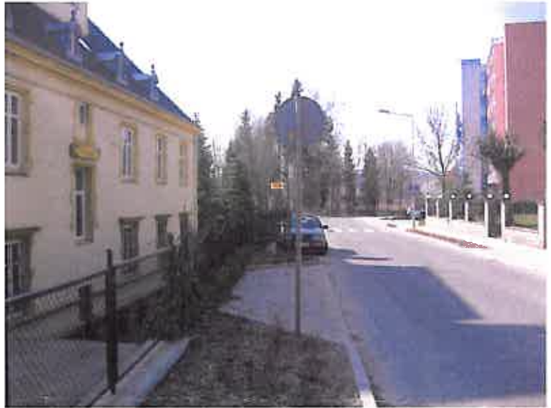
Zdjęcie nr 16