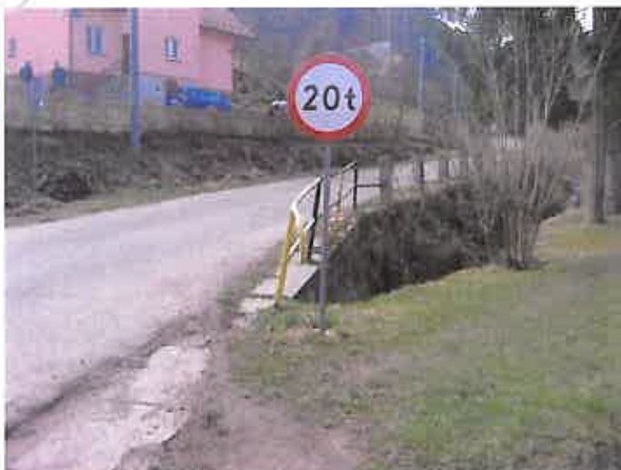
Zdjęcie nr 5