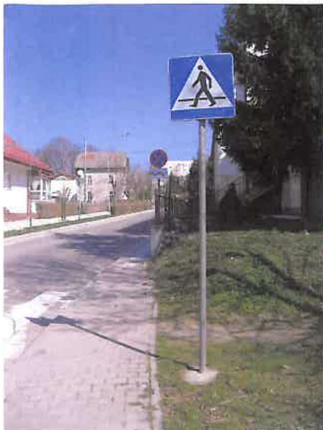
Zdjęcie nr 27