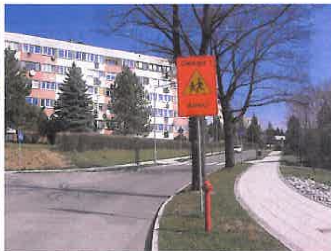
Zdjęcie nr 26