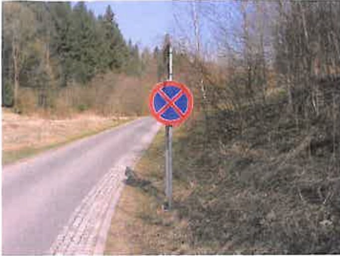
Zdjęcie nr 11