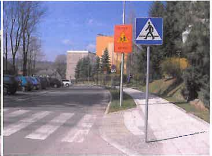
Zdjęcie nr 22