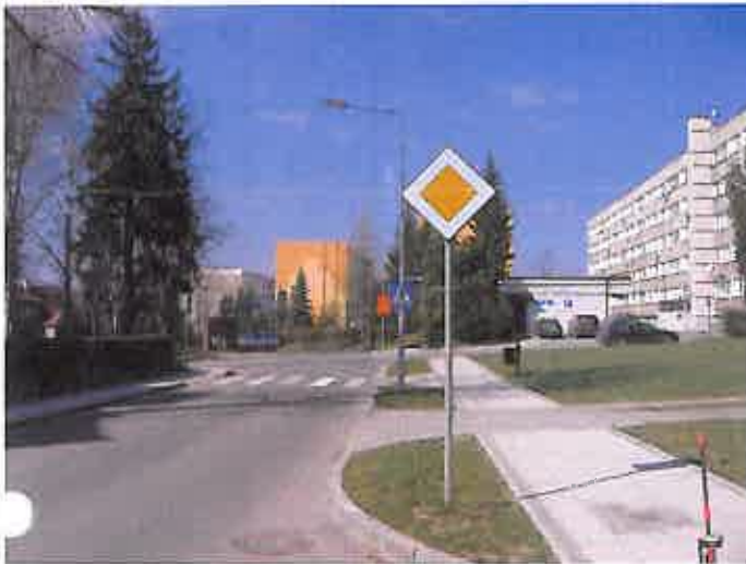
Zdjęcie nr 21