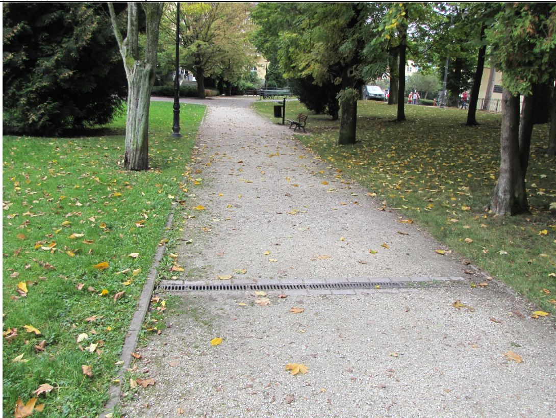
Widok na alejkę parkową.