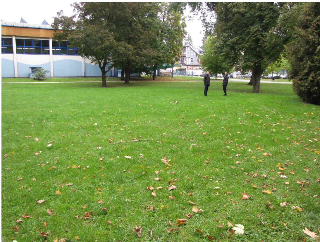
Widok na park.