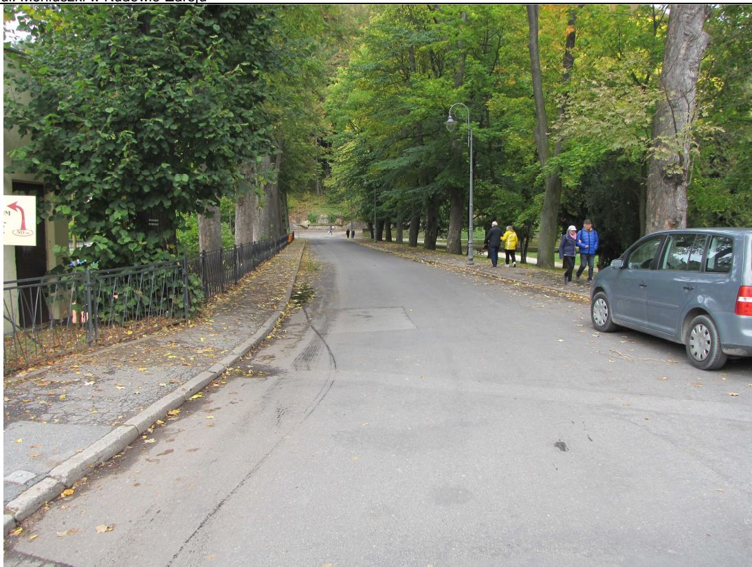
Widok na remontowaną i przebudowywaną część ul. Moniuszki.

Inwestycja : Budowa boiska do gry w boule wraz zagospodarowaniem terenu oraz remont i przebudowa chodników i oświetlenia na części ul. Moniuszki w Kudowie-Zdroju