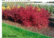
Bebrerys Thunberga 'Atropurpurea'