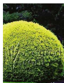
Taxus baccata 'Elegantissima'