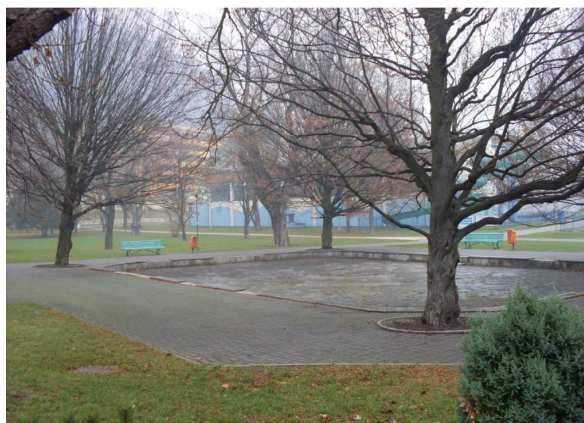
Fot.2,3. OBSZAR OPRACOWANIA Autor: P. Dorota Dąbrowska