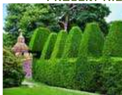
Taxus baccata Cis pospolity