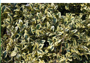
Buxus sempervirens 'Elegans'