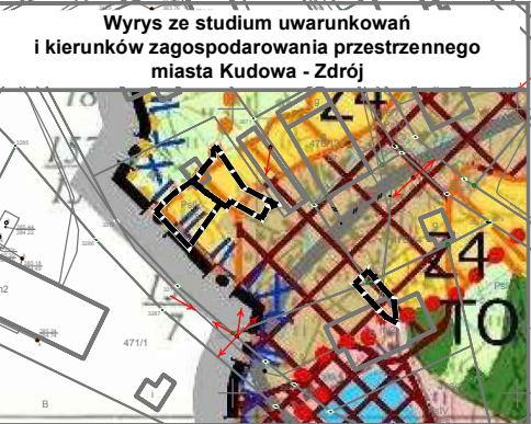
Wrys ze studium uwarunkowań i kierunków zagospodarowania przestrzennego miasta Kudowa - Zdrój